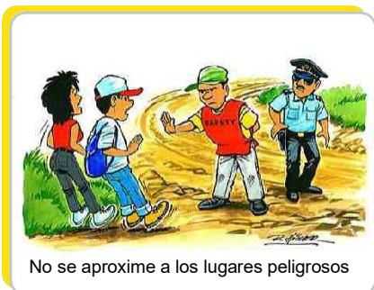
No se aproxime a los lugares peligrosos