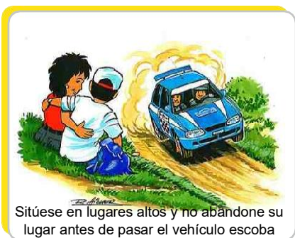
Sitúese en lugares altos y no abandone su lugar antes de pasar el vehículo escoba