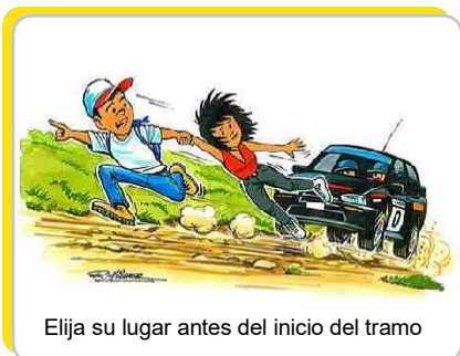
Elija su lugar antes del inicio del tramo